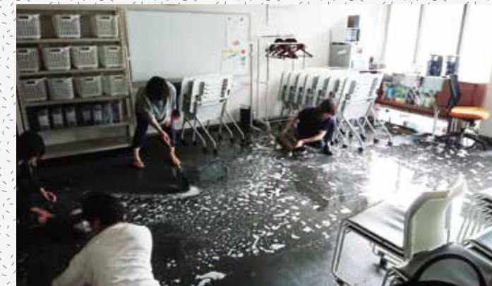
懸命に浸水のかきだしを行うユニカレスタッフ

令和元年8月28日の九州北部豪雨の影響で、佐賀駅バスセンター北側はおおよそ60センチ冠水しました。ユニカレさが本校では床上22センチの浸水があり、被災しました。 この影響で8月28日は全校休校となりましたが、翌29日から別教室を借り受け、9月4日まで授業を実施しました。その間、被災した教室の復旧に向けて職員が作業を行いました。その結果、被災後1週間で本校は暫定的に使用可能となり、通常の授業を行えられるようになりました。 復旧作業の間に多くのお見舞い、激励、アドバイス頂き、また、作業へのお手伝いなど、多くの方にお気遣いを頂けましたことにスタッフ一同ここから御礼申し上げます。