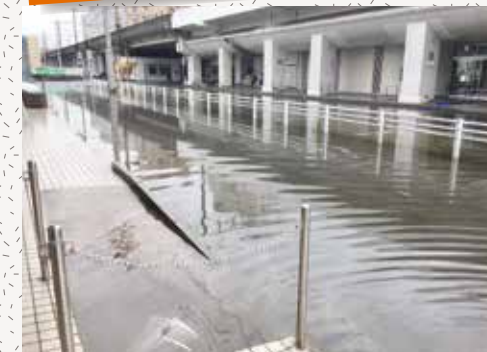
8月28日15時の時点での佐賀駅バスセンター